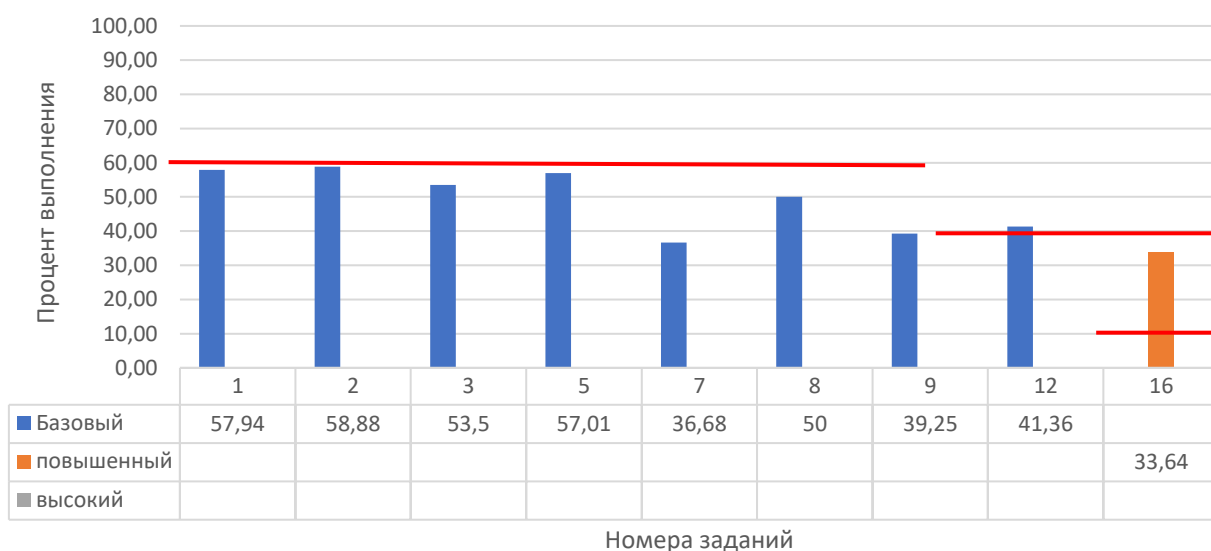
Рисунок 2. Задания, по которым участники не преодолели минимальный порог

Анализ результатов участников и типов заданий, попавших в перечень (табл. 2, рис. 2), выявил следующие частые затруднения участников экзамена: